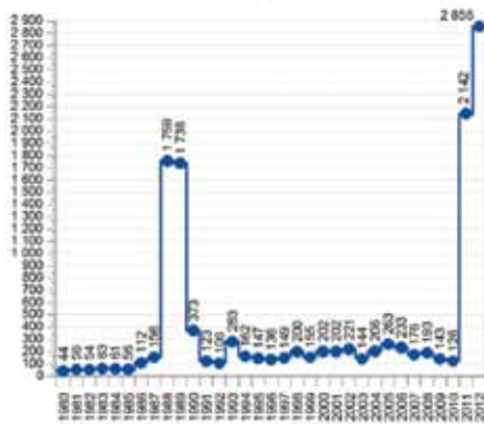
Grafik 2: Tunus'ta STK'ların sayılarının yıllara göre dağılımı (1980- 2012)