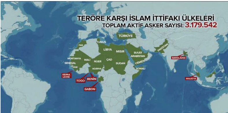
Harita 1: Teröre Karşı İslam İttifakı Ülkeleri 15

Kuveyt 26 Haziran tarihinde Şuilerin kullandığı İmam Sadık Camii'ne gerçekleştirilen terör eylemi ile sarsılmıştır. IŞİD'in üstlendiği saldırıda 26 kişi yaşamını yitirmiş, 227 kişi de yaralanmıştır. 12 Cumhurbaşkanı Erdoğan bu saldırı üzerine yaptığı açıklamada, Kuveyt'te mezhep çatışması çıkarmayı amaçlayan bu saldırıların terörizmle mücadelede gerek bölgesel gerekse uluslararası işbirliğini elzem kıldığını vurgulamıştır. 13 Kuveyt'in 2015 yılında dış politikada attığı önemli adımlardan biri, Aralık ayında aralarında Türkiye'nin de bulunduğu 34 ülkenin Suudi Arabistan merkezli "Teröre Karşı İslam İttifakı"na katılması olmuştur. 14