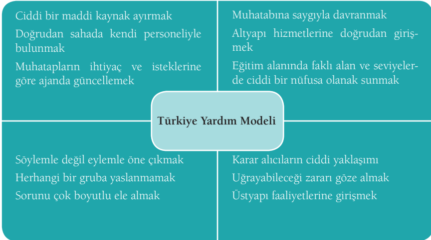
Şekil 2: Türkiye Yardım Modeli 53

Türkiye, acil insani yardımlarla kıtlığın ölümcül boyutunun etkisini azalttıktan sonra kalkınma yardımlarıyla ekonominin canlanmasına katkı sunmuş ve süreçte ulusal bir mutabakat tesis edip devleti kurumsallaştırarak istikrarlı bir Somali'ye ulaşmak amacıyla hareket etmiştir. Maksada ulaşabilmek için sadece kendi imkânlarının yeterli olmadığını bilen Türkiye